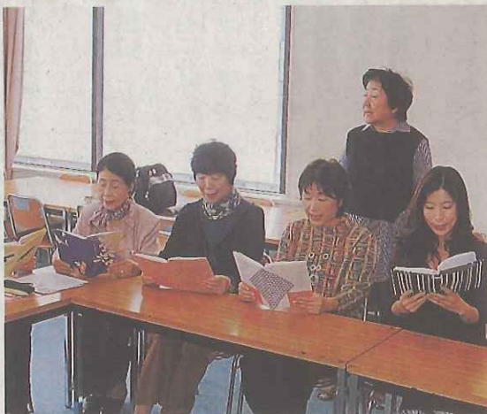
アクセントや滑舌など、基本的な発声を全員で練習